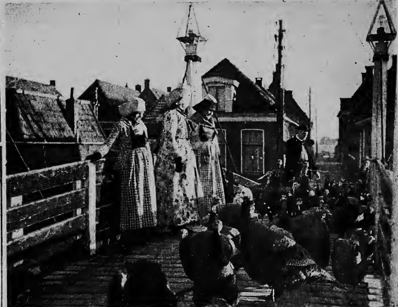
E kalacunan aki ta di un cuneco na Hulanda caminda nan ta cria nan na cantidad pa bende cu dianan di Pascu manera i pasa e anja aki atrobe. Riba e foto nos por mira e hendenan bisti tipicamente manera ta costumbre na e lugar ei.